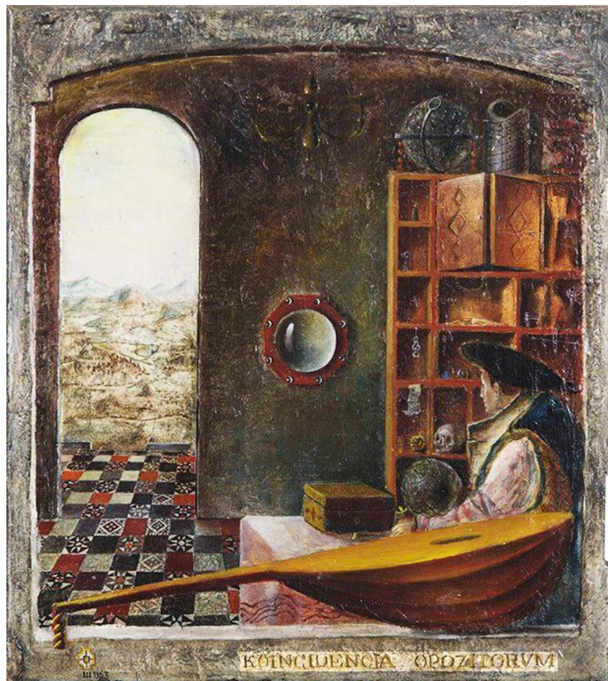
Coincidentia oppositorum (стециште супротности; „Сједињавање супротстављеног и супарничког води превазилажењу његове поједначне коначности и доспевању у бесконачно“ – Никола Кузански) – Соба Николе Кузанског, Леонид Шејка, 1963.

непрактичну, „нереалну“ и „онострану“ борилачку уметност, она може тако освештаног, узвишеног и култивисаног карактера да се благородно спусти ка „овостраној“, реалној и профаној употреби јер као таква више неће бити дивљачко оруђе варваризације човека већ божанско оруђе његовог оплемењивања.